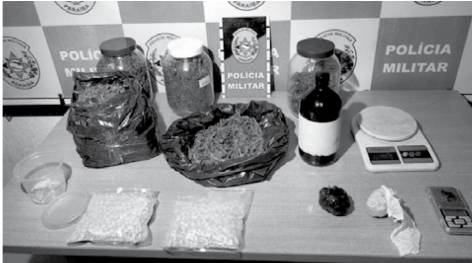
Diversos tipos de drogas foram apreendidos em bairros diferentes; nas duas ações, os responsáveis conseguiram fugir quando os policiais chegaram ao apartamento e ao carro onde estavam os entorpecentes

A apreensão da droga sintética aconteceu em apartamento no Bairro Jardim Cidade Universitária, na zona sul da Capital. No local, equipes da Força Tática do 5º Batalhão apreenderam entorpecentes de quatro tipos diferentes. Além da MDMA também foram apreendidos