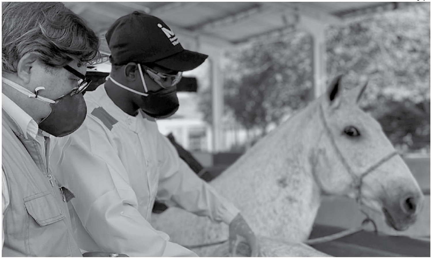
Pesquisadores do Instituto de Bioquímica Médica da Universidade Federal do Rio de Janeiro apresentaram estudo sobre soros produzidos por cavalos

A pesquisa tem apoio financeiro da Faperj, do Conselho Nacional de Desenvolvimento Científico e Tecnológico (CNPq), da Coordenação de Aperfeiçoamento de Pessoal de Nível Superior (Capes) e da Financiadora de Estudos e Projetos (FINEP).