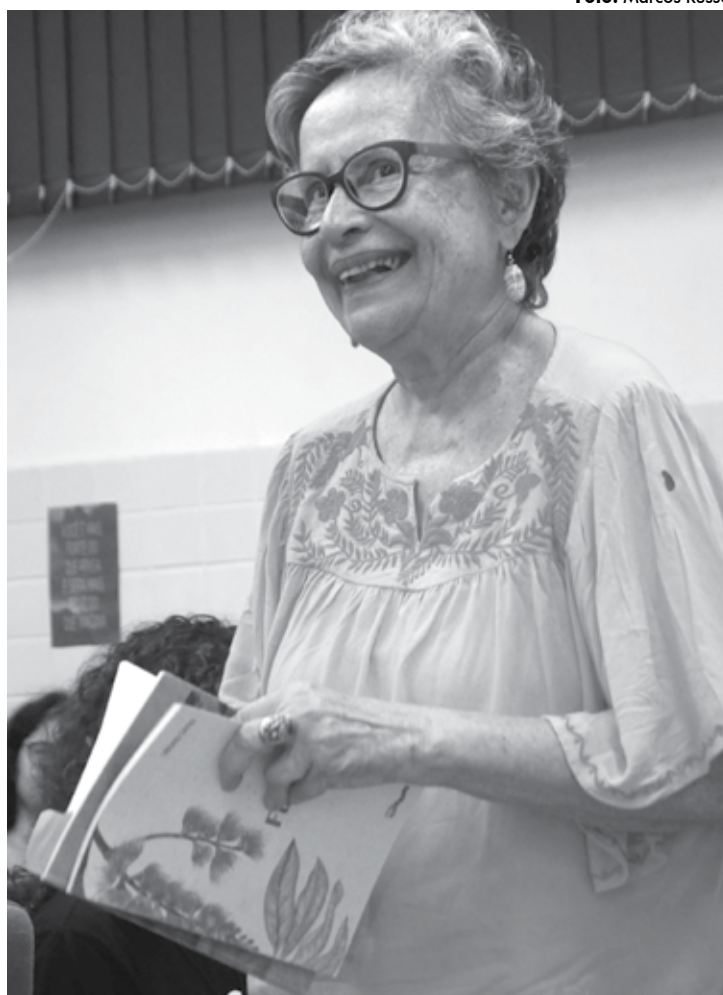
Poetisa é colunista do Jornal 'A União' e autora de 'Anos bissextos' e 'Fúcsia'

Por outro lado, Vitória alija "as lebres de vidro do invisível", o inefável, o etéreo, os temas metafísicos, em