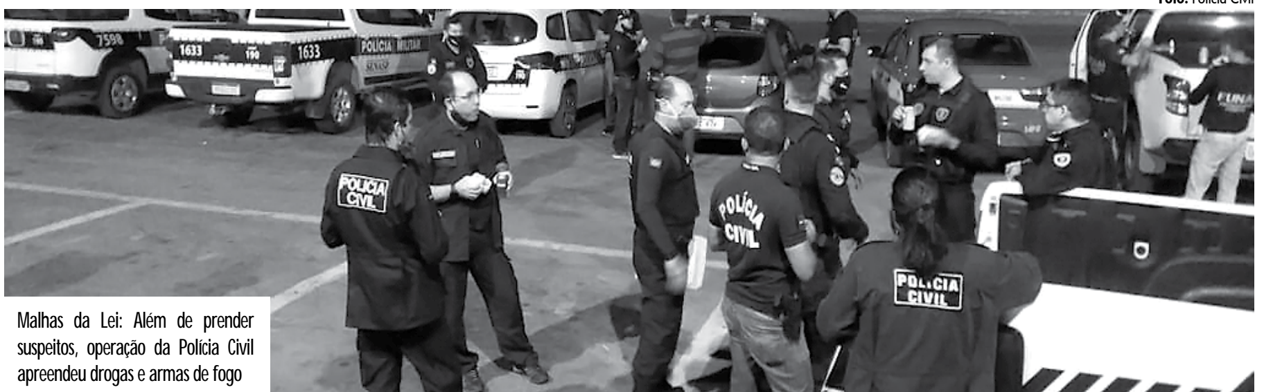
Malhas da Lei: Além de prender suspeitos, operação da Polícia Civil apreendeu drogas e armas de fogo

A nova fase da Operação "Malhas da Lei" teve a coordenada da Polícia Civil e contou com apoio da Polícia Militar e Corpo de Bombeiros. Um representante da