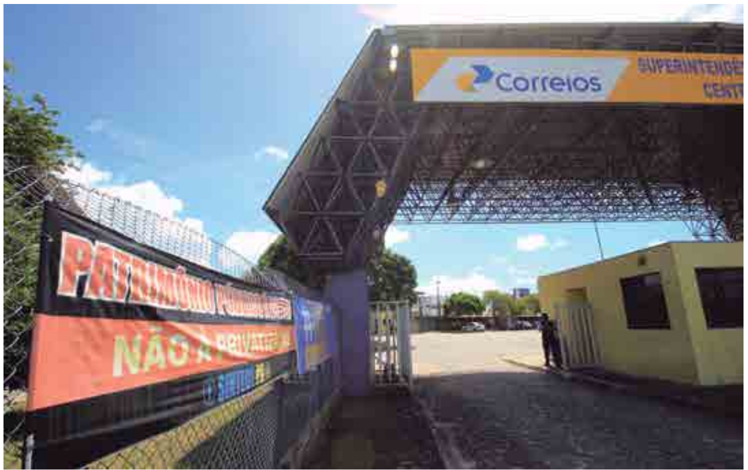
Sindicato dos trabalhadores da empresa alega que acordos trabalhistas não estão sendo cumpridos e Correios afirma que apresentou suas propostas

Tony exemplifica resultados da privatização em outros países para ilustrar que este não deve ser o caminho seguido pelo Brasil. “Na Argentina e em Portugal, por exemplo, as tarifas subiram, houve demissão de funcionários e precarização dos serviços. Não é interessante à iniciativa privada ter uma agência em uma pequena cidade ou em um bairro mais afastado, por exemplo”.